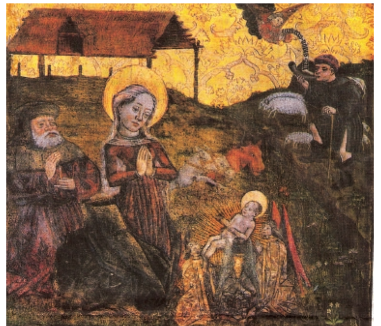
Christi Geburt. Weihnachtsdarstellung am Marien-Altar der Kirche vom Malmkrog (Malincrav). Der gotische Flügelaltar stammt aus der Zeit um 1495. Das Jesuskind ist von Engeln umgeben, Maria und Josef beten es an, dahinter sind Ochs und Esel zu sehen. Von rechts kommt ein Hirte, der ins Horn bläst, mit seiner Herde von den Bergen, während ihm ein Engel vom Himmel die Geburt verkündet.