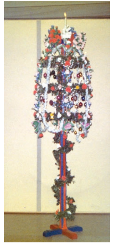
Christleuchter aus Rode, der in den 1970er Jahren bei der Jahreshauptversammlung der Nachbarschaft Traun gezeigt wurde.

deskonsistoriums im Jahr 1988 fanden im Sachsenland noch in 40 Gemeinden Leuchterbinden und -singen zu Weihnachten 1987 statt. Jüngere Statistiken sind dem Verfasser nicht bekannt.